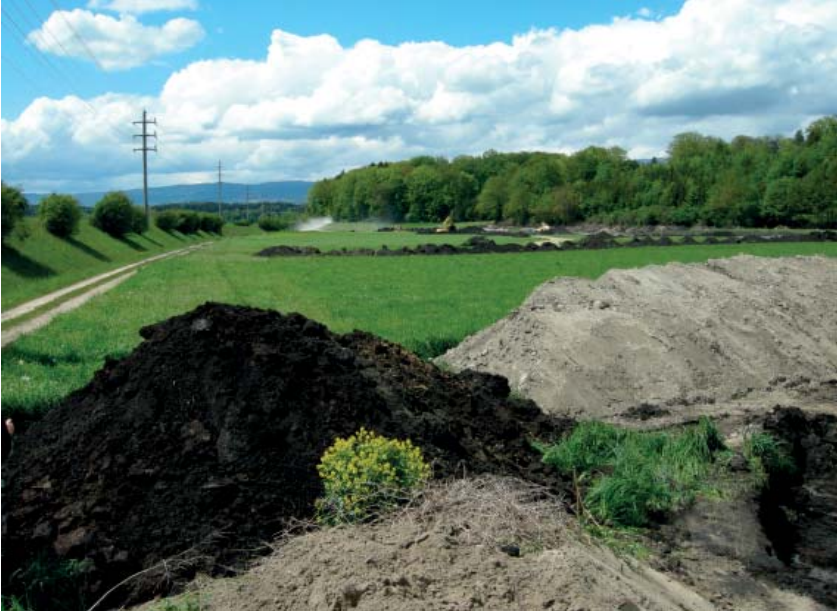
Bauarbeiten für ein neues Seitengewässer im Espenmoos