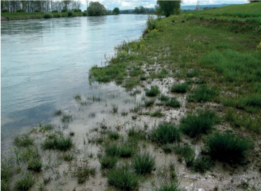
Riedwiesen im Flachuferbereich leisten einen Beitrag zur Artenvielfalt