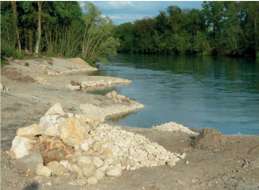
Neue Buchten und Flachufer erhöhen die Strukturvielfalt

Die Herleitung der ökologischen Aufwertungsmassnahmen für das Sanierungsprojekt erfolgte auf der Grundlage von systematisch definierten Projektzielen. Dabei galt es, in ständiger gegenseitiger Abwägung gleichzeitig die gesetzlichen Anforderungen sowie die technische und finanzielle Machbarkeit zu berücksichtigen.