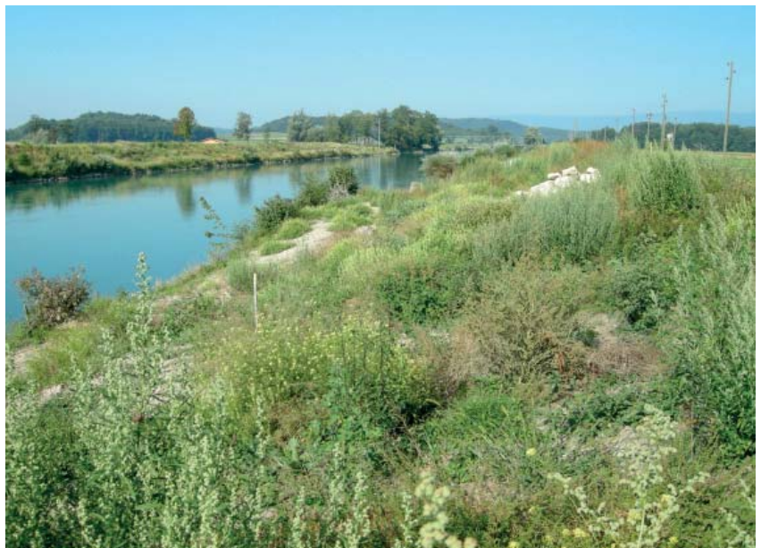
Durch die Aufwertung der Dammböschungen mit Gehölzgruppen und Steinlinsen entstehen neue Lebensräume für Kleintiere

Die Besonderheit des Kanals liegt darin, dass er nicht durch eine ursprüngliche Flusslandschaft führt, sondern die Aare in einem künstlichen Gerinne von ihrem ursprünglichen Lauf ableitet. Deshalb lässt sich das Fließgewässer nicht im herkömmlichen Sinne renaturieren. Das kantonale Wasserbaugesetz verlangt aber auch in solchen Fällen eine naturnahe Gestaltung, wobei dieses Teilziel gleichwertig mit der Gefahrenbewältigung gewichtet wird.