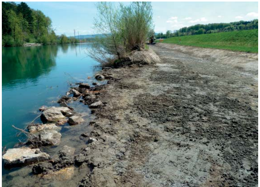
Ausgestaltung eines Flachufers für neue Riedwiesen am sanierten Hagneckkanal