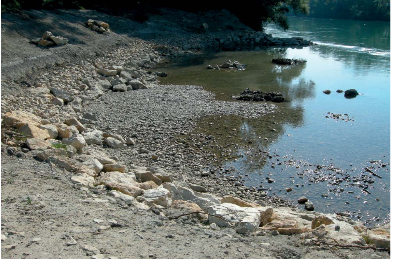
Aufbruch zu neuen Ufern

wie Landwirtschaft, Grundwassernutzung oder Erholung – abzustimmen. Schliesslich sollen die Qualität und Langlebigkeit der ökologischen Massnahmen mit einem integralen Gewässerpflege- und Unterhaltsplan sowie einer Wirkungskontrolle langfristig sichergestellt werden.